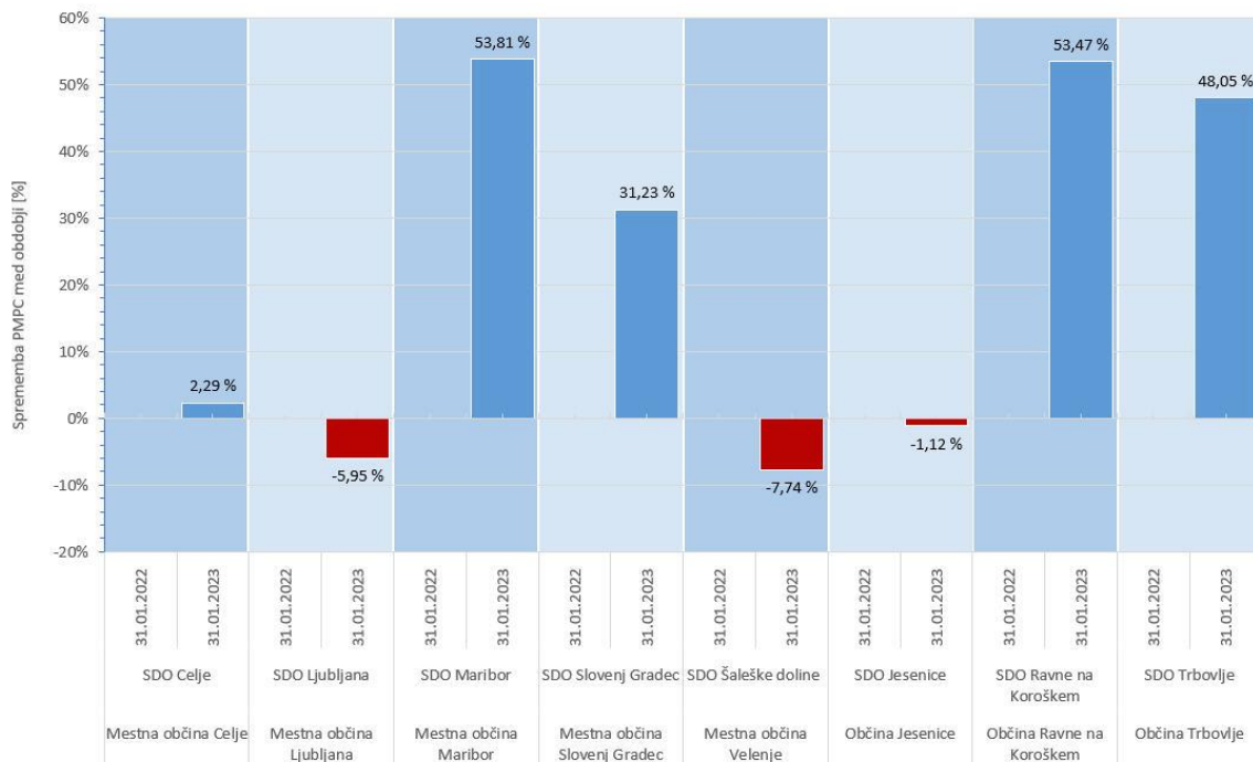
Graf 3: Sprememba povprečnih maloprodajnih cen toplote med obdobji (januar 2023/januar 2022)