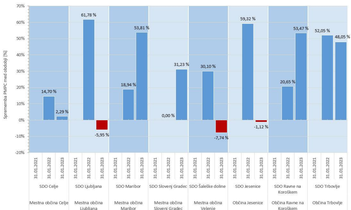
Graf 4: Sprememba povprečnih maloprodajnih cen toplote med obdobji (januar 2022/ januar 2021, januar 2023/ januar 2022)