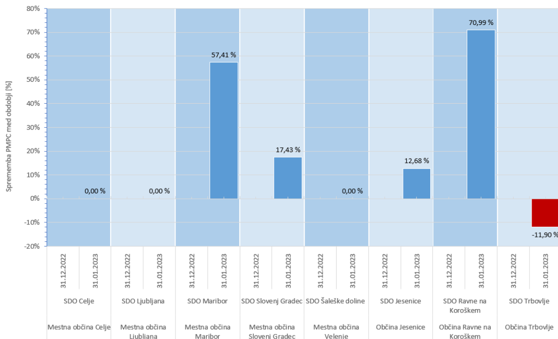
Graf 2: Sprememba povprečnih maloprodajnih cen toplote med obdobji (januar 2023/december 2022)